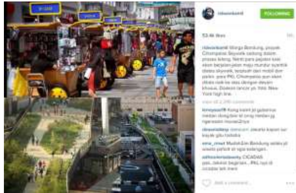
Gambar 1 Foto Unggahan Ridwan Kamil